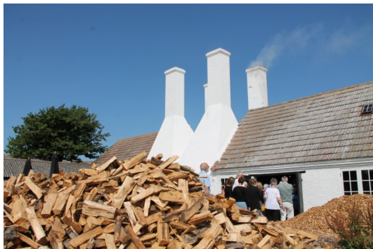
Un casa pro fumar.

Paulo: Ambular. Nos pote lassar nostre bicyclos ci.